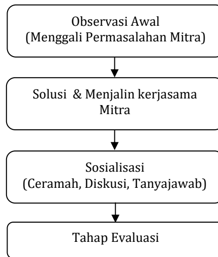
Gambar 1. Pelaksanaan Pelatihan Marinasi Daging Itik untuk Peningkatan Keamanan Pangan di SMK N 4 Kendal