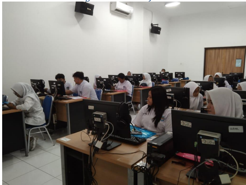
Figure 2 Ruang Lab Bahasa BBJ

Pengabdian ini melibatkan metode ceramah, diskusi, praktik, dan observasi. Ceramah dan diskusi sebagai sarana untuk menyampaikan materi pengabdian kepada para peserta didik. Praktik dilaksanakan di akhir sesi, yaitu berupa simulasi pengerjaan tes TOEFL oleh para peserta didik dengan mengoperasikan komputer yang difasilitasi oleh BBJ USM. Dengan melakukan simulasi mengerjakan tes TOEFL tersebut para peserta didik mendapatkan pengalaman riil dan menjadi bekal nantinya ketika mereka mengikuti tes TOEFL yang berbasis komputer.