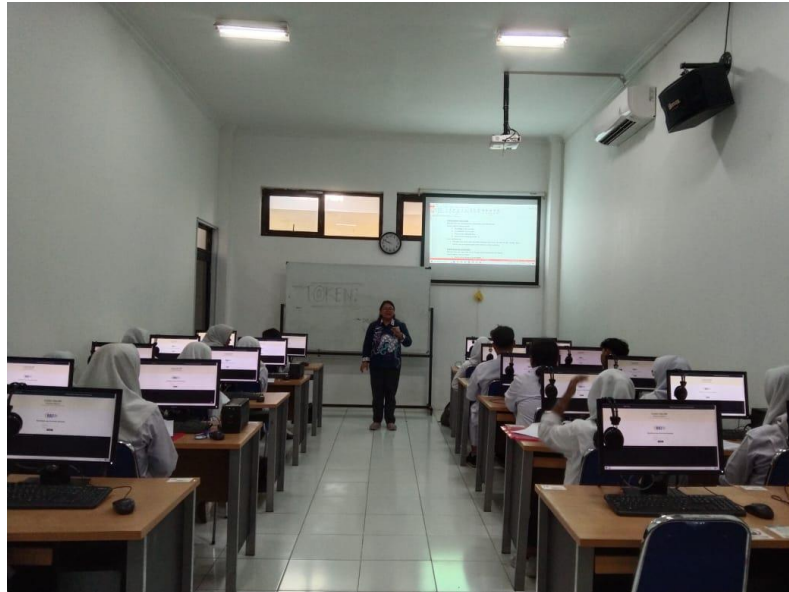
Figure 3 Pemaparan materi pelatihan TOEFL

Paparan materi pengabdian utamanya mengulas tentang strategi mengerjakan soal-soal TOEFL. Strategi yang diajarkan meliputi strategi menjawab soal listening , structure and written expression , dan reading . Para peserta didik menyimak materi dengan seksama dan antusias karena mereka baru mengetahui ada strategi tertentu untuk mengerjakan soal-soal TOEFL.